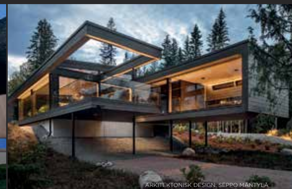
ARKITEKTONISK DESIGN: SEPPO MÄNTYLÄ