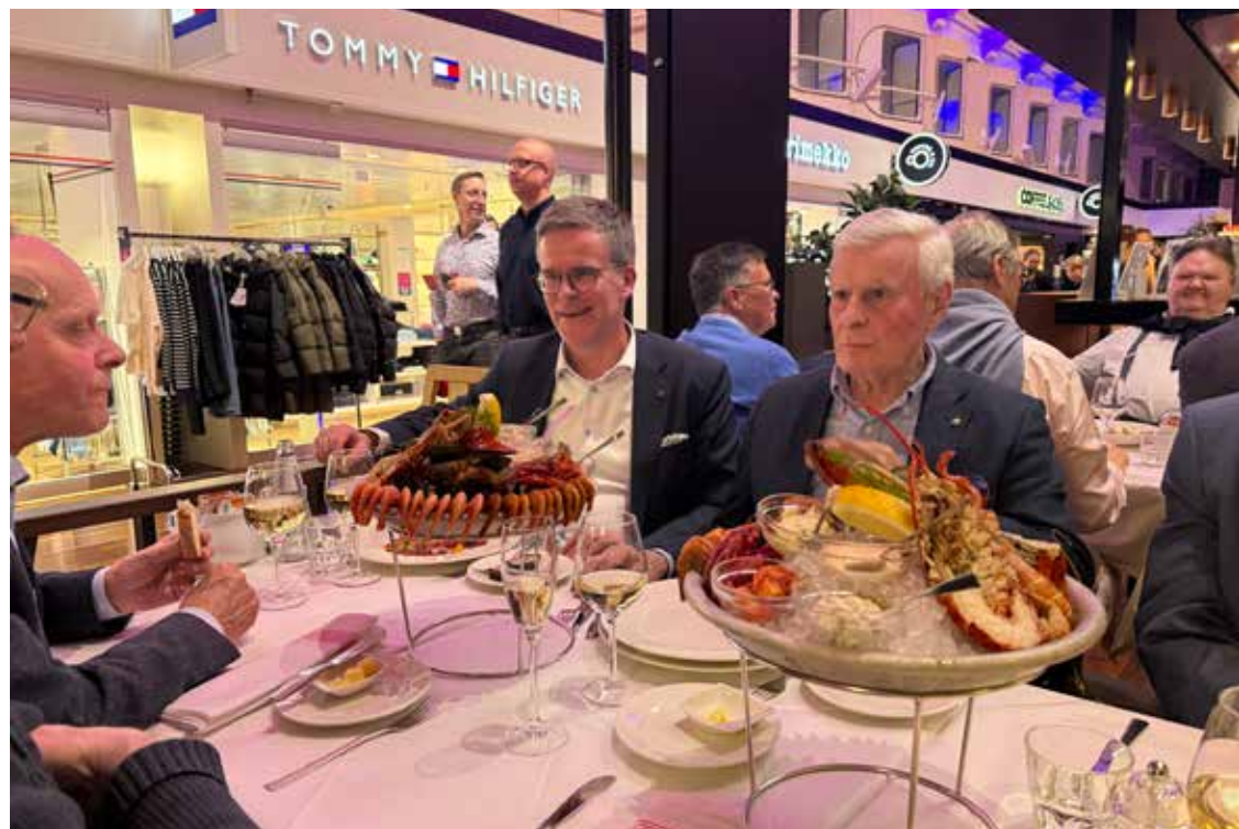
Under hemresan njöt herrarna bland annat av havets läckerheter