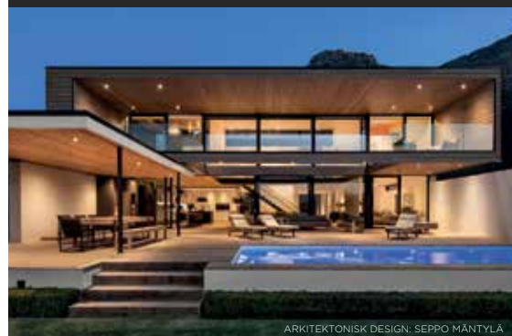
ARKITEKTONISK DESIGN: SEPPO MÄNTYLÄ