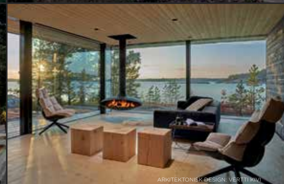
ARKITEKTONISK DESIGN: VERTTI KIVI