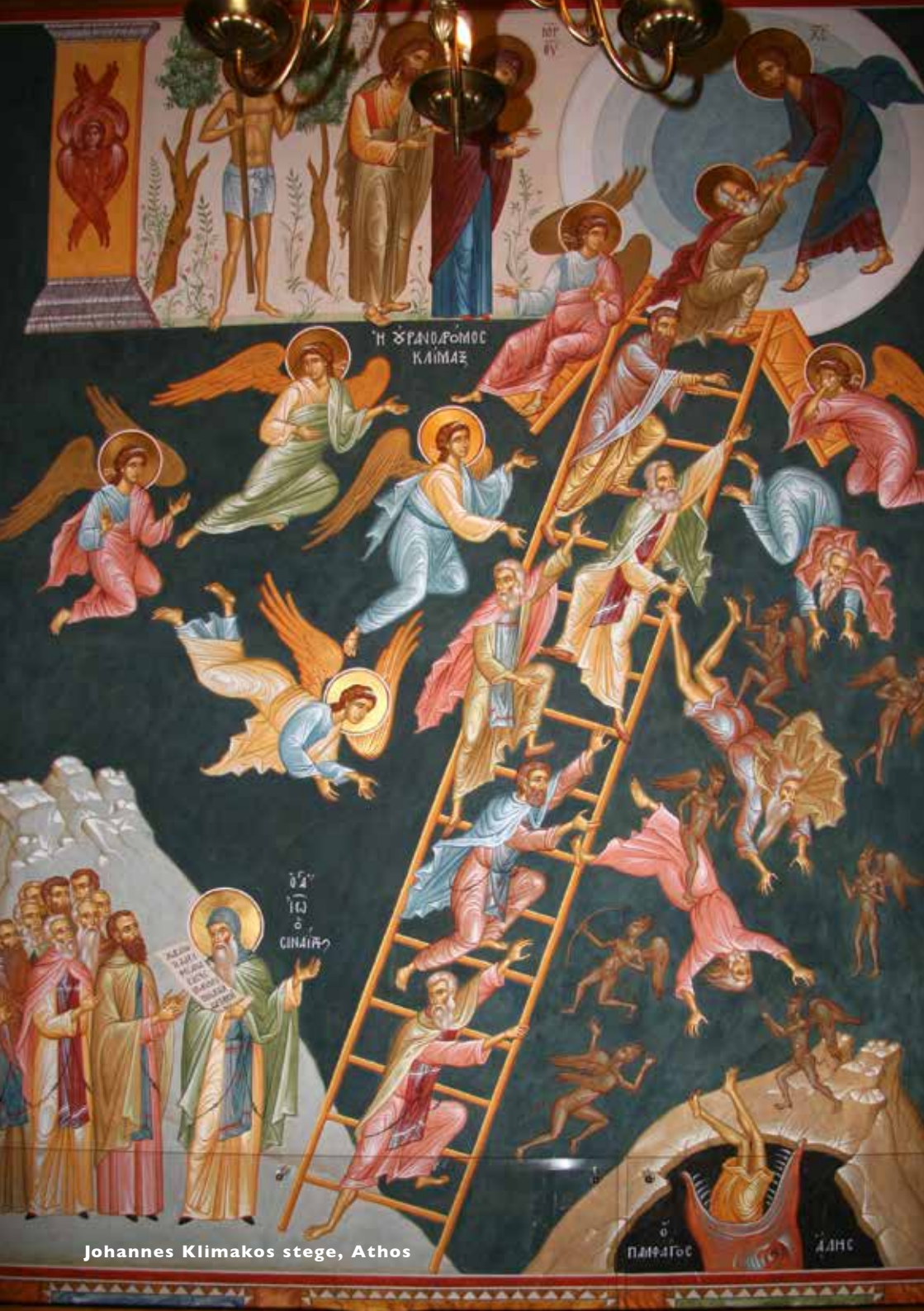
Johannes Klimakos stige, Athos