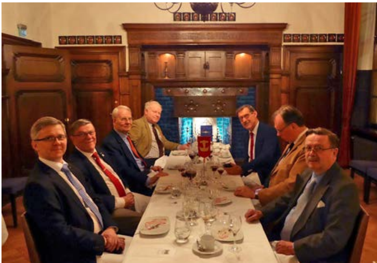
Före jul brukar det inte vara rusning till klubbaftnarna. Här ryms man in i Lilla matsalen den 14 december.