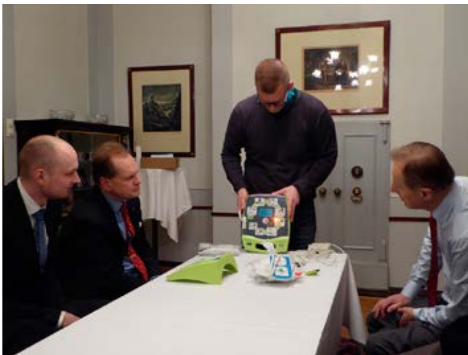
En defibrillator donerades till Klubben av Johanniterhjälpen hösten 2016. Här skolas Klubbens och restaurangens människor att använda apparaten.