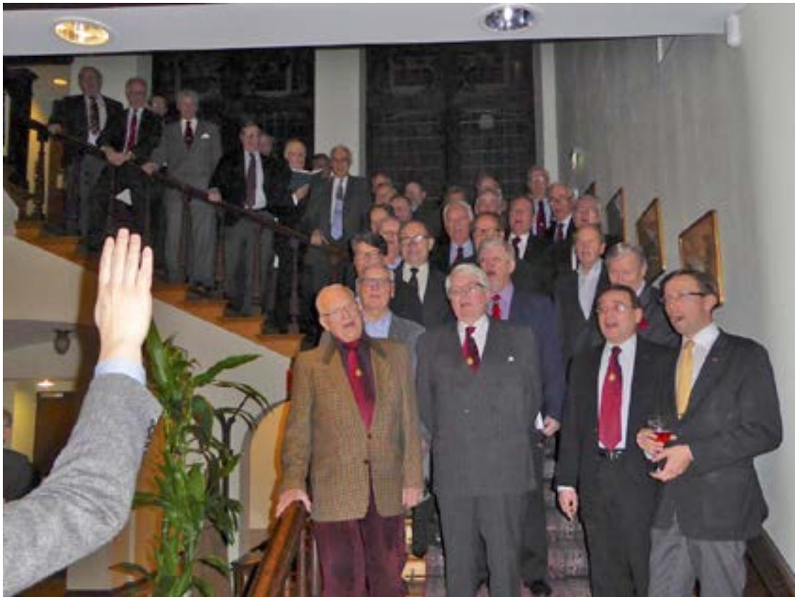
Vårsäsongen öppnas traditionellt av vår bolagist MM med trappsång, varpå följer öl-snaps-korv afton i Spegelsalen. Sång är då undantagsvis tillåten.

Organ för Svenska Klubben i Helsingfors r.f Grundad år 1880 • Nummer 1, februari 2017