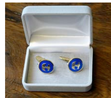
Förgyllda silvermanschettknappar med blå emalj: 60 € / par