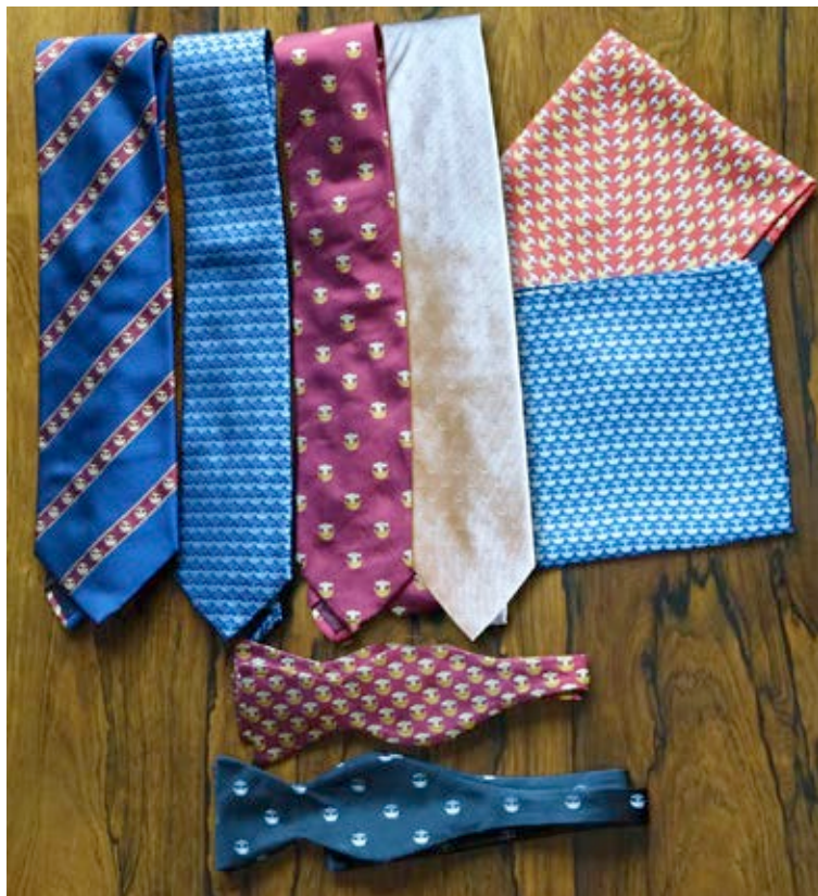
Slipsar, blå, röd, silver resp. gammal modell: á 30 €. Fluga, röd eller svart: á 30 €. Ficknäsduk, blå eller röd: á 20 €.

Betalning sker till Klubbens konto: FI23 4055 1120 0021 04