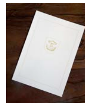
Adress (hyllnings- eller kondoleans), vanlig: á 15 € Adress (hyllnings- eller kondoleans) med tofs: á 25 €