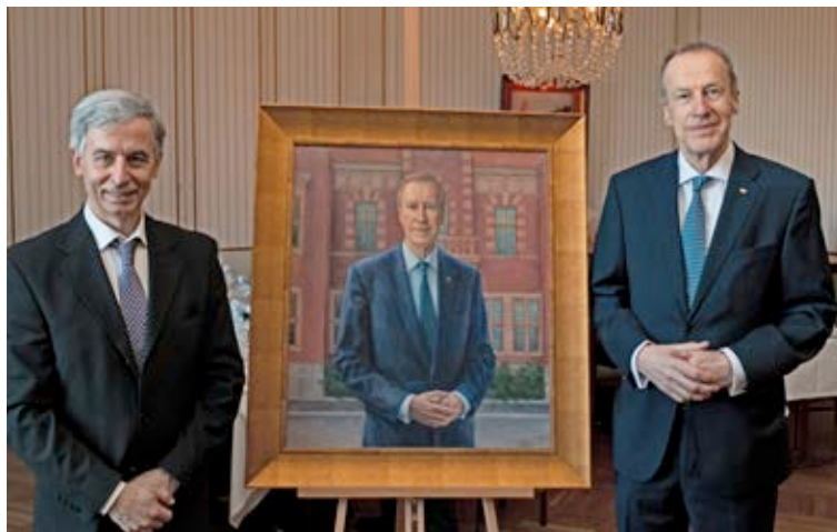
Konstnären och modellen.