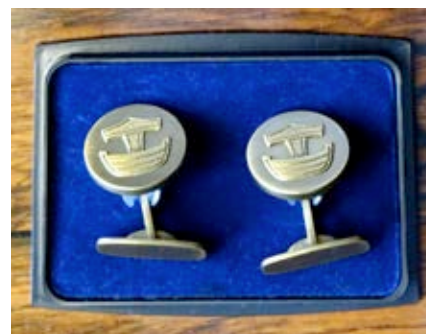
Bronsmanschettknappar: 30 € / par