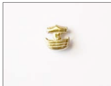
Klubbnä, förgyllt silver (pins): á 20 €