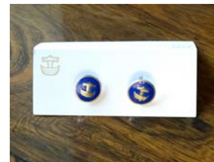
Silvermanschettknappar med blå emalj: 50 € / par