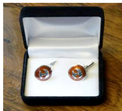
Nya silvermanschettknappar med röd emalj: 60 € / par